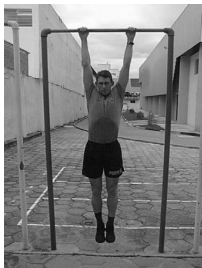
Figura 03 Posição 3 Final do Exercício