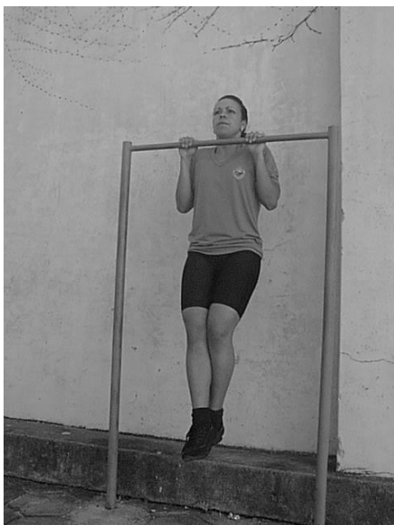
Figura 01 Posição de Execução do Teste