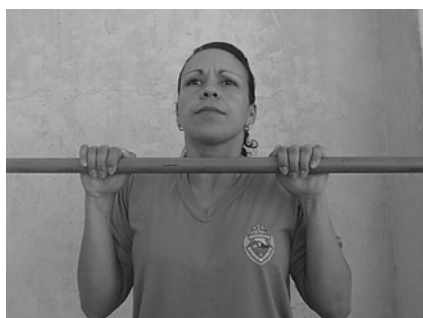
Figura 02 Detalhe de Execu- ção do Teste