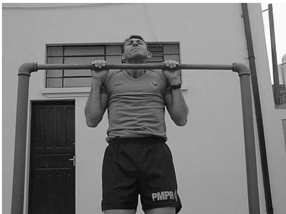
Figura 02 Posição 2 Intermediária.