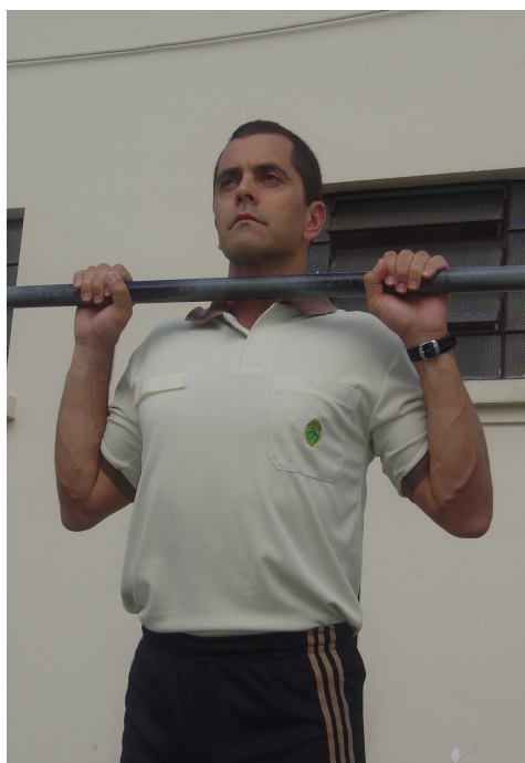
Figura 3 - Posição 2 intermediária.