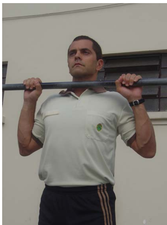
Figura 3 - Posição 2 intermediária.