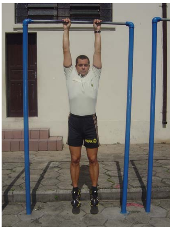
Figura 2 - Posição 1 inicial, e, Posição 3 final.

d) Número de repetições: conforme tabela.